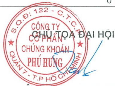
Ông CHEN CHIA KEN